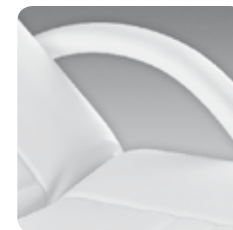
coppia braccioli curvi curved arm rest couple cod. 106