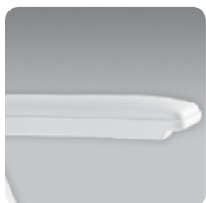
coppia braccioli automatici flat arm rest couple cod. 107