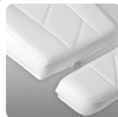
versione Bi-Zak Bi-Zak version cod. 105112