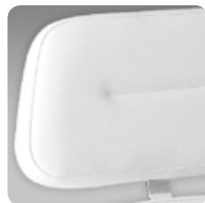
testa Zak grande big Zak head rest cod. 111