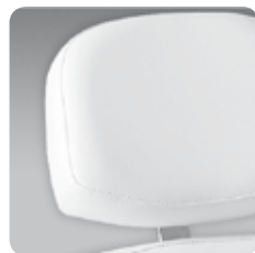
testa Zak piccola small Zak head rest cod. 111P