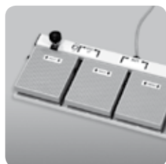
pedale foot pedal control cod. LEM-067