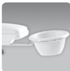
coppia bacinelle manicure manicure bowl couple cod. 006