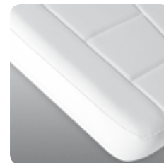
materasso morbido soft mattress cod. 110