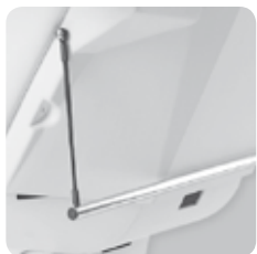
porta rotolo roll holder cod. 108