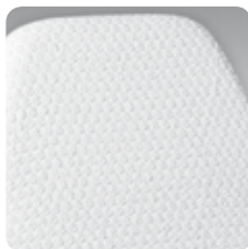
copriletino bed sponge cover cod. 114