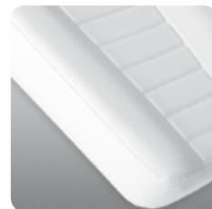
materasso anatomico anatomic mattress cod. 109