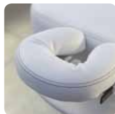
testa americana american face hole cod. 112